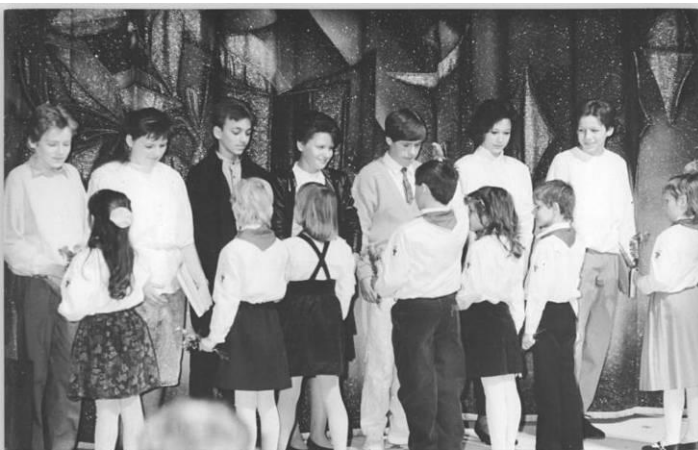
Festakt einer Jugendweihe im März 1989 in Berlin-Lichtenberg

Beide, Jugendliche und Eltern, müssen sich aber die Frage gefallen lassen, wofür sie sich damals und heute entschieden haben.