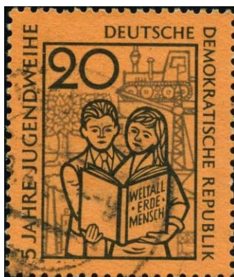
DDR-Briefmarke: 5 Jahre Jugendweihe

unter Androhung und auch Umsetzung von negativen Folgen für die Entwicklung des Kindes und der Eltern veranlasste viele Eltern, sich dafür zu entscheiden und sich von der Kirche zu verabschieden. So wurde die erste Generation von der Kirche entfremdet, deren Kinder wurden schon gar nicht mehr getauft und inzwischen haben wir es mit der 3. Generation kirchen- und glaubensfremder Menschen zu tun, die überwiegend keinen Kontakt mehr zur Kirche hat. Der Zeitpunkt des 14. Lebensjahrs ist nicht der Übergang zum Erwachsensein, sondern der anfängliche Bezug