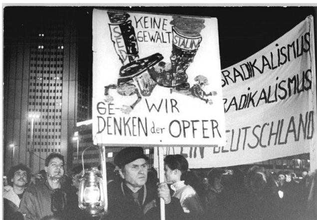
18. Dezember 1989

Es ist aber für die Demokratie wichtig, dass genügend Christen als „Hefeteig“ an dem Ort wirken, an dem sie tätig sind.