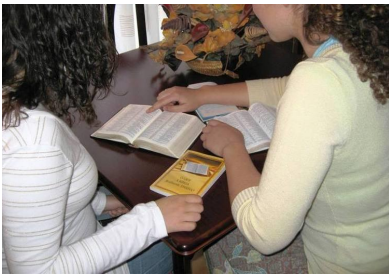
Darstellung eines Bibelkurses

einer Religionsgemeinschaft, die KdöR werden will, eine grundsätzliche Rechtstreue und eine Anerkennung grundlegender Prinzipien unseres Grundgesetzes, jedoch keine darüber hinausgehende Loyalität zum Staat. Das dann abschließend inhaltlich entscheidende OVG Berlin sah diese Anforderungen schließlich bei JZ grundsätzlich gewährleistet, was auch durch Einzelfälle nicht infrage gestellt wird. Auch werde der Kinderschutz z. B. bei Transfusionen durch entsprechende rechtliche Verfahren gewährleistet.