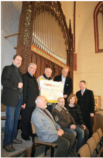
Übergabe von Fördermitteln an Vertreter der Mönchskirche in Salzwedel

„Der Förderverein Barock-Kirche Karow e.V. und die Kirchengemeinde sind sehr glücklich und dankbar, dass Ihre Gesellschaft unseren Kampf um die Erhaltung unserer schönen Barock-Kirche mit einer sehr großzügigen Spende von 39.000 Euro unterstützt...“ Solch spontaner Dank, in diesem Fall sogar in Briefform, erreicht LOTTO Sachsen-Anhalt immer wieder einmal und bestätigt Geschäftsführung und Mitarbeiter darin, dass die angelegte gemeinnützige Förderung aus einem festen Teil der Spieleinnahmen im wahren Sinne des Wortes gut ankommt. Seit Beginn der 1990er Jahre sind mehr als eintausend Lottoschecks ausgestellt worden, die Kirchen in Sachsen-Anhalt vor dem Verfall gerettet haben.