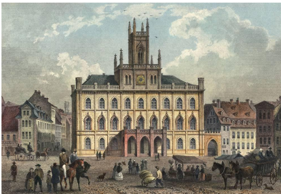
Rathaus Weimar um 1850