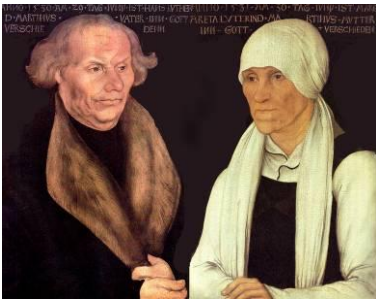
Luthers Eltern, Hans und Margarethe Luther von Lucas Cranach d.Ä

Wir glauben, über Martin Luther einigermaßen bescheid zu wissen.