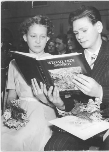
Weltall Erde Mensch