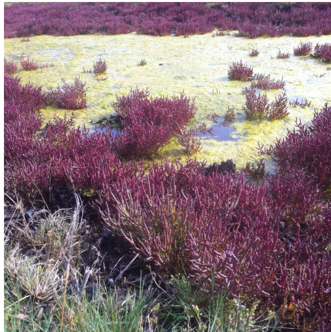
Sülldorfer Salzwiesen Salz-Schuppenmiere

umzugehen. In Zukunft wird es wichtiger werden, Naturschutz nicht als statisch, sondern als dynamisch zu begreifen. Dieser Weg muss konsequent weitergegangen werden, um nicht die Natur vor dem Menschen zu schützen, sondern den Menschen als Teil der Natur.