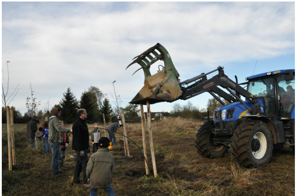
Baumpflanzung bei Vissum (Altmarkkreis Salzwedel) mit alten Obstsorten an einer sogenannten "Alten Heerstraße" (landwirtschaftlicher Weg) als Ersatzpflanzung durch den Naturerbeverein Vissum e.V. (ausgezeichnet u.a. durch den OSGV als Verein des Jahres und die Stiftung Umwelt-, Natur- und Klimaschutz Sachsen-Anhalt)

„Naturraum“. Beim Straßenbau zum Beispiel wird Fläche versiegelt. Als Ausgleich wird hierzu eine alte Straße auf derselben Fläche zurückgebaut mit der Folge, dass nunmehr die gleiche Menge Regenwasser versickern kann. Ersatz heißt, die Beeinträchtigungen werden an anderer örtlicher Stelle ausgeglichen. Dies ist zum Beispiel der Fall, wenn an anderer Stelle als der Straße Bäume gepflanzt werden. Erst wenn dies nicht zum Tragen kommt und ein Ausgleich so nicht möglich ist, kommen Ersatzzahlungen in Frage. Hierfür sind die durchschnittlichen Kosten für die entsprechen-