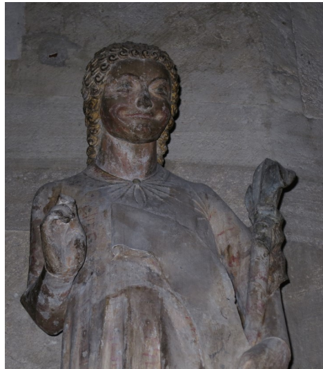
Lächelnder Engel im Magdeburger Dom

Er lächelt. Feinsinnig, froh, gewinnend. Die junge Frau, der er gegenübersteht, ist verstört, verschreckt, weiß noch nicht, wie sie mit dieser unerhörten Begegnung umgehen soll. Aber sie hält stand, läuft nicht weg, will sich dem stellen, was ihr gleich gesagt wird. Sie ahnt noch nichts von der Botschaft, aber jetzt schon ist sie sicher, dass es etwas sein wird, das ihr Leben von Grund auf verändern wird. Denn ihr steht kein Mann gegenüber, das merkt sie schon, sondern ein Gesandter Gottes, ein Engel, eine Person gewordene Botschaft des Höchsten. Schon jetzt geht das über ihren Verstand. Aber sie hält stand. Und der Engel? Er lächelt. Er steht, weder gerufen noch erwartet, vor dieser jungen Frau – und sie ist ziemlich jung – und lächelt. Ja, doch, er lächelt sie an.